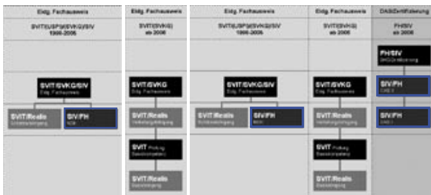
1 2 3

Die Ausbildung baut auf dem seit mehreren Jahren an Schweiz. Hochschulen angebotenen Nachdiplomkurs Immobilienbewertung (CAS I) auf (zur Logik