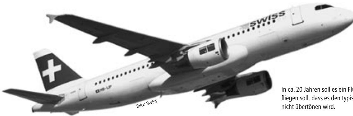
In ca. 20 Jahren soll es ein Flugzeug geben, das so leise fliegen soll, dass es den typischen Lärm in städtischen Gegenden nicht übertönen wird.

sächliche Transaktionen. Ausserdem wurden Informationen wie Exposition, Aussicht, Erreichbarkeit und Immissionen aus dem Geographischen Informationssystem GIS der ZKB verwendet. Die EMPA lieferte die nötigen Daten zur Fluglärmbelastung. Nach Angaben von Unique (Pressemitteilung vom 14.9.2005) und der ZKB (NZZ 3.11.2005) erlaubt der MIFLU-Bewertungsprozess, den wertvermindernden Einfluss von Fluglärm aus Transaktionspreisen zu isolieren. Dazu kommt ein Augenschein eines Schätzers vor Ort, bei dem der Modellwert überprüft und allenfalls angepasst werden kann.